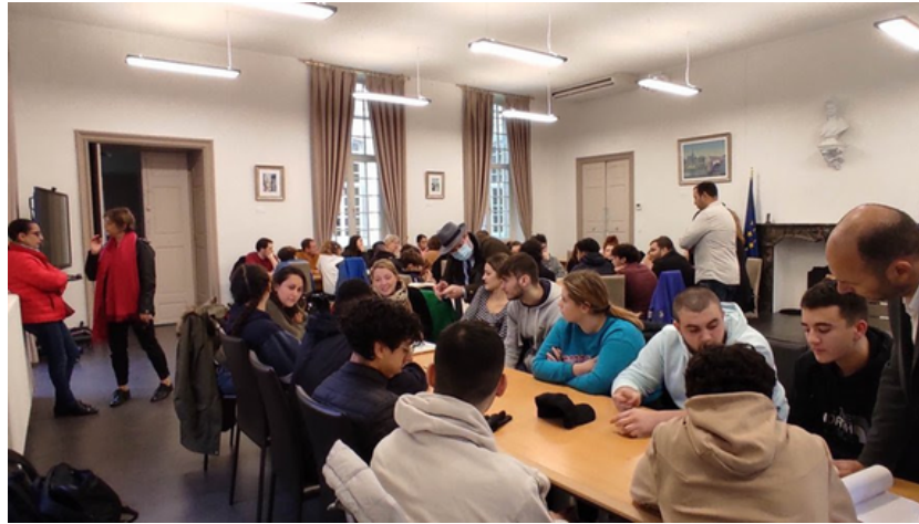
Les 45 jeunes ont notamment évoqué la création d'un conseil des jeunes de 16 à 25 ans.

Initiés le 7 décembre 2022, les ateliers des Assises de la jeunesse se sont poursuivies en 2023 à Limoux. La citoyenneté, la vie sociale et la culture étaient au programme.