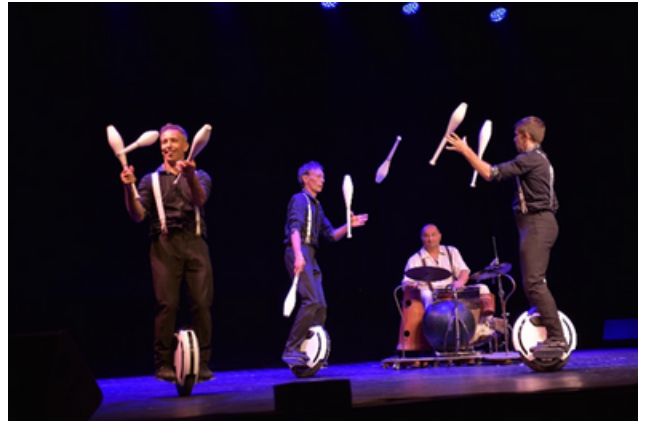
Le 25 Août, « Les Excentriques »