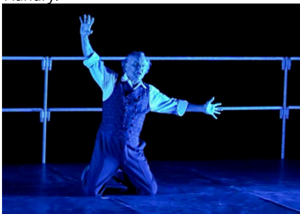
Philippe Caubère, dans Les étoiles, le 21 Juillet 2023