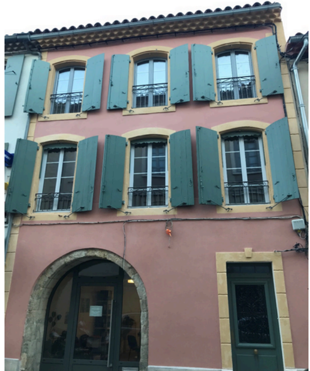
Programme de rénovation des façades centre ancien Rue Jean Jaurès