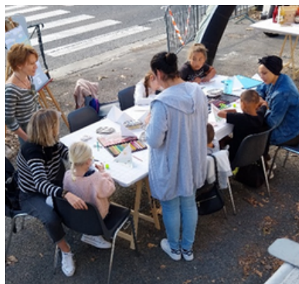
Le musée étant fermé, l'atelier s'est déroulé en extérieur.