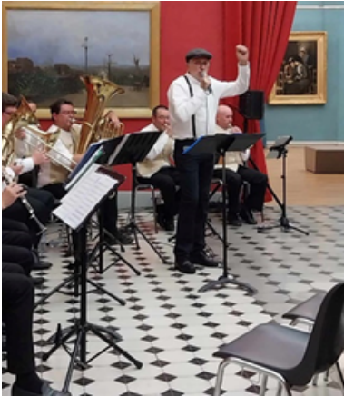
Concert hommage à la musique « Belle-époque » joué par le groupe Kiosque 1900