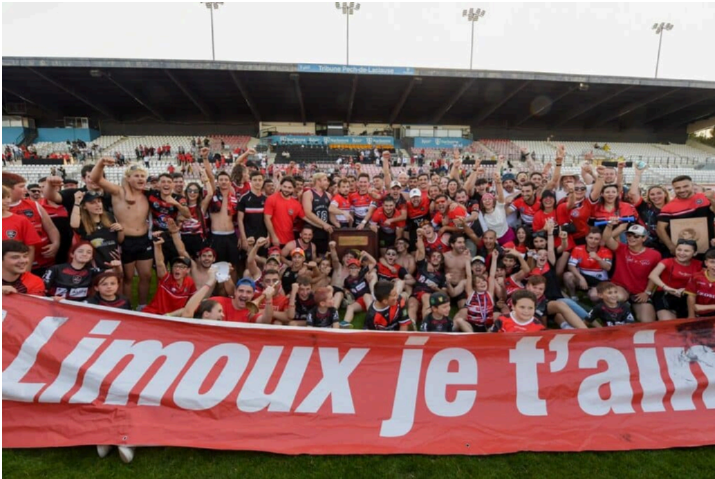
Le XIII Limouxin champion de France de Rugby à XIII en Mai 2023 à Narbonne au terme d'une finale exceptionnelle devant près de 11 000 spectateurs.