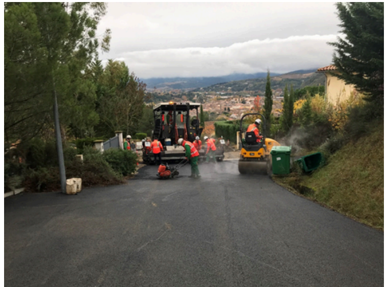
Travaux de voirie Chemin Lacanal