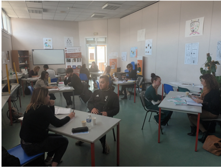
Job dating avec les recruteurs Limouxins

L'équipe du Pôle Entreprise de la Mission Locale met tout en oeuvre pour faciliter l'accès à l'emploi des jeunes de notre territoire. Nous organisons tous les mois des visites d'entreprises, des « vis ma vie », des forums de l'Intérim, des ateliers « droits du travail » et « job expresso » afin de préparer les jeunes aux entretiens d'embauche.