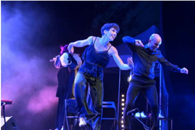
Le 24 Août, « Feet, une histoire des danses jazz »

Et 3 spectacles sur l'Aude ont eu lieu du 24 au 26 Août, à l'Île de Sournies, pour clôturer cette saison estivale.