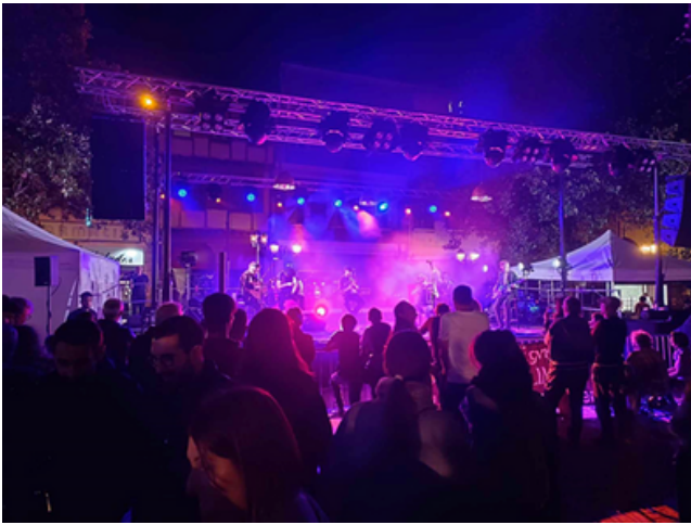
La foule était au rendez-vous sur la Place, à l'occasion de "Vendanges en fête" 2023.

La foule, venue nombreuse, s'est rassemblée autour de stands-buvette de vins tranquilles et vins effervescents ; et des stands de restauration tenus par des commerçants locaux (fromager, charcutier, traiteur, locomotive à châtaignes, pâtissier, et l'Association du XIII Limouxin).