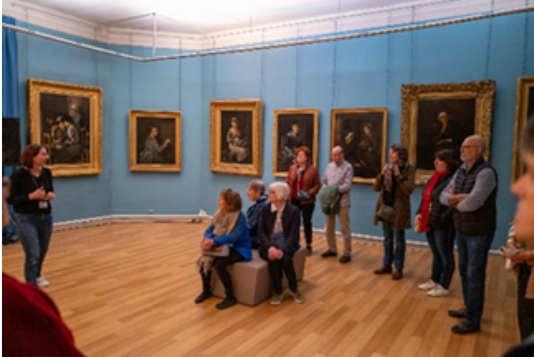
Visite commentée animée par la médiatrice culturelle du musée Petiet

-Le samedi 20 mai, jour de fermeture avant travaux : ambiance « Belle époque » avec le groupe Kiosque 1900. Une visite découverte des collections a ouvert le bal. Un apéritif dinatoire a complété ce moment de convivialité et d'échange en partenariat avec la Cave Anne de Joyeuses.