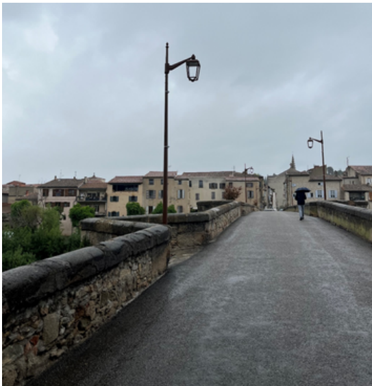
Rénovation de l'éclairage public – Pont Neuf