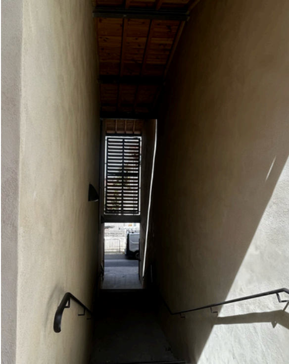
Passage du Tivoli